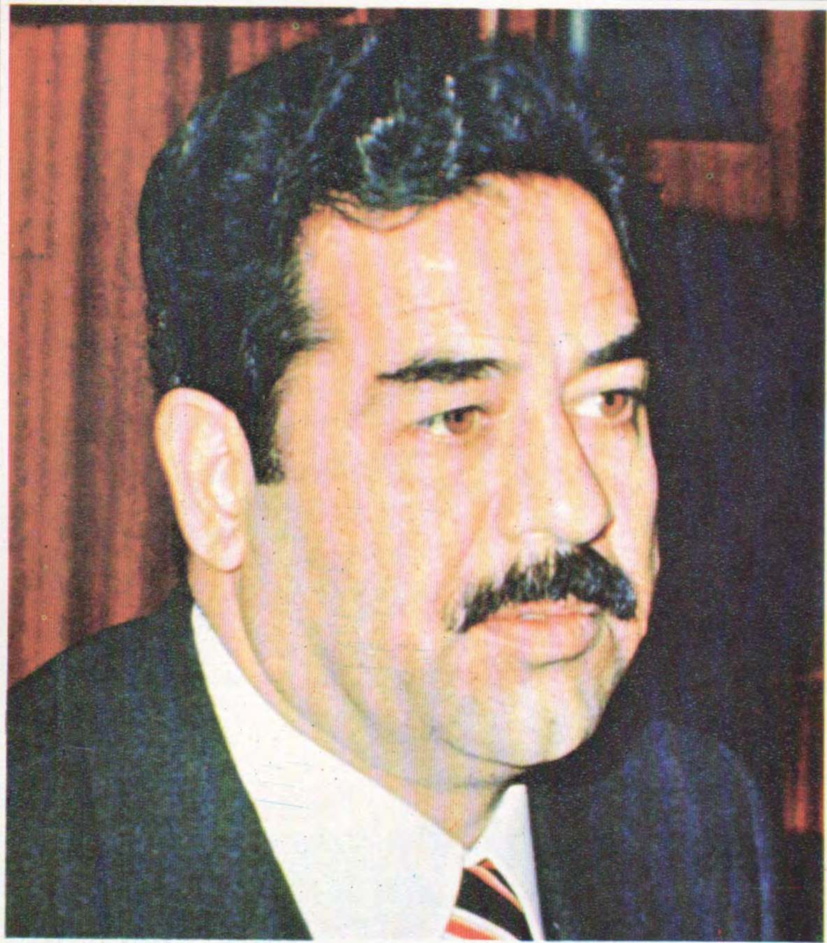
هاورئ خەباتگىرسەرۆك صدام حسين