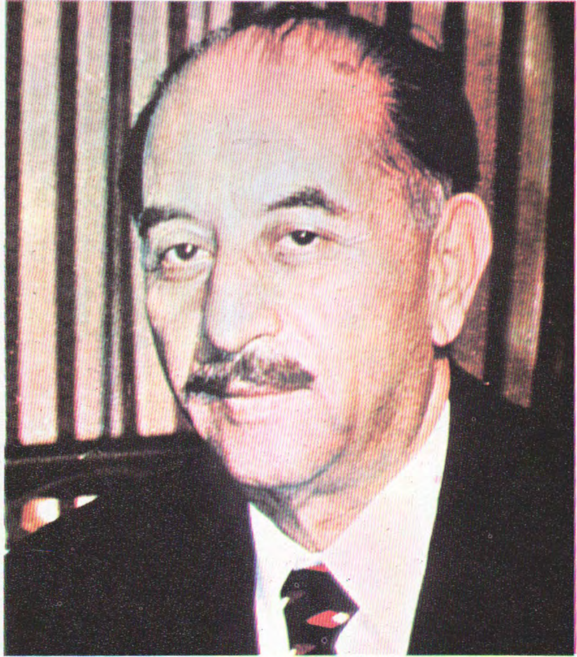
باوکی فہرماندہ خدباتگیر احمد حسن البکر