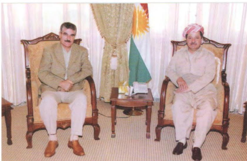
لهگه‌ل کاک مه‌سعود بارزانی