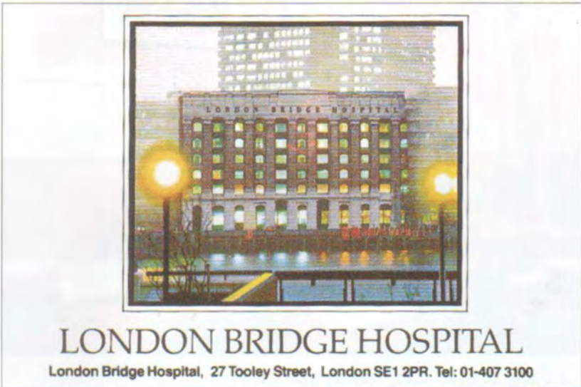
نه‌خۆشخانه‌ی (له‌ندهن بریج) له له‌ندهن