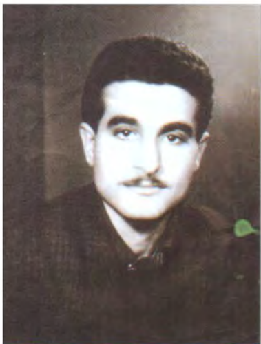
شهید نه کرمی وه سستا همه نه مین به نا ناسراو به نه کرمی چه پسه، سالی (۱۹۸۰) له موسل له سیداره درا