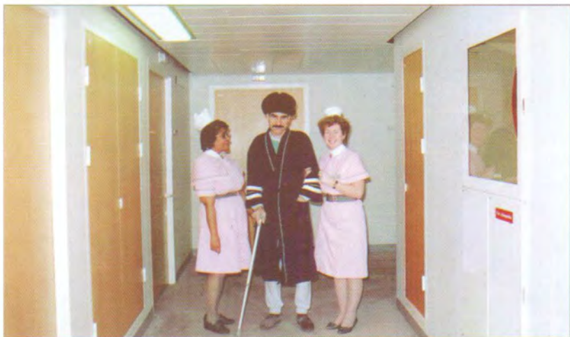
له نه‌خۆشخانه‌ی (له‌ندهن بریج) له له‌ندهن. ساڵی ۱۹۸۷