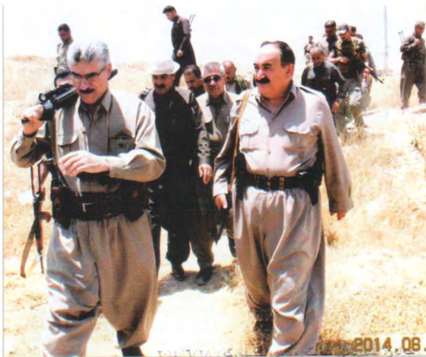
جہلولا سردانی سنگرہکانی پیشمرگہ . ۲۰۱۴/۶/۲۸