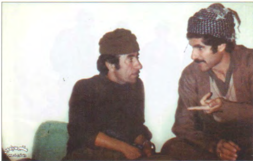
شه‌هید جه‌مالی عالی باپیر و مسته‌فا چاوپه‌ش. ۱۹۷۹