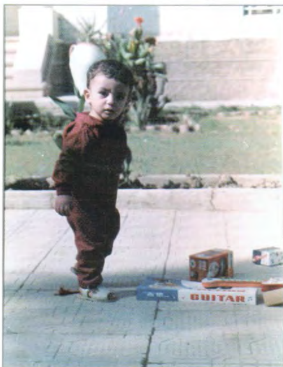
زریانی کۆرم له به‌ندینه‌خانه‌ی شه‌منی عامه‌ی به‌غداد، سالی ١٩٨٧