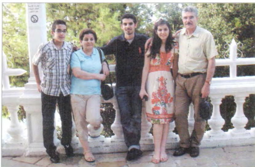
مستهفا چاورهش، زهینۆی کچی، زریانی کۆری، نه‌هاوندی هاوسه‌ری. دابانی کۆری