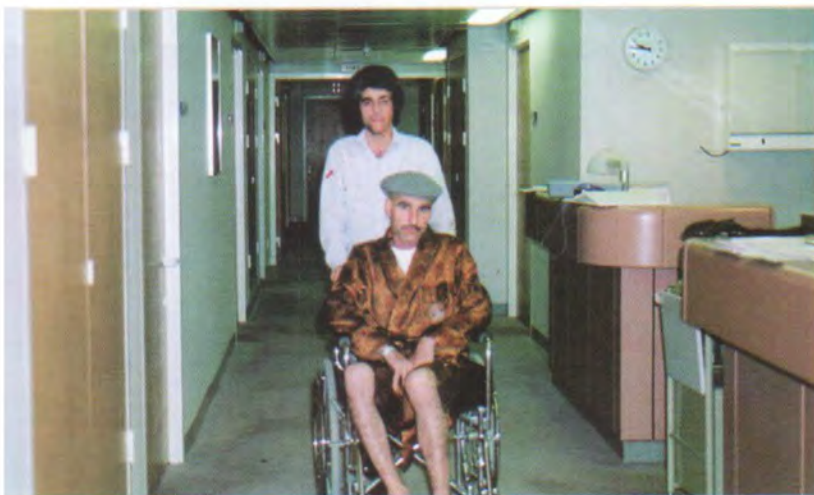
له نه خوشخانه ی (له ندهن بریج) له له ندهن. سالی ۱۹۸۷