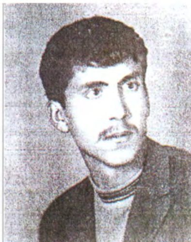
شهید بیستون مه لا عومر سالی (۱۹۸۷) له سیروان شهید بوو.