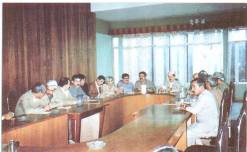
شه قلاوه . کۆبوونهوه به سه‌یه‌رشتی مه‌سعود بارزانی پیش شه‌ری (په‌که‌که) سالی (١٩٩٢)