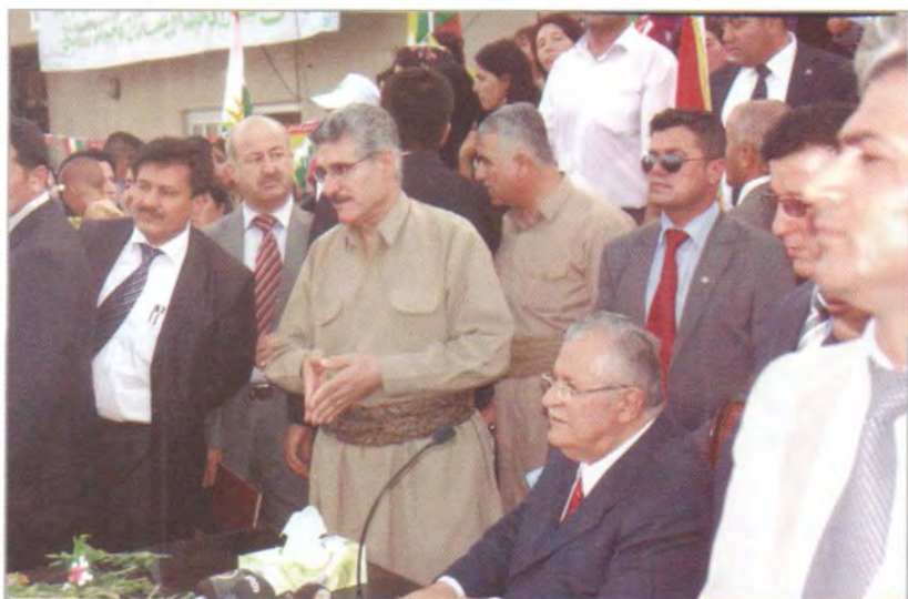
پانیہ، لہگل بہریز مام جہلال. ہہلبژاردنہ کانی سالی ۲۰۰۹