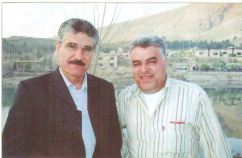
لہگل ماجد محمدہ نہمینی پورزام. سالی ۲۰۰۴