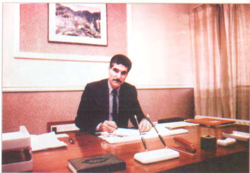
پاریزگاری که رکوک. سالانی (١٩٩٢ / ١٩٩٣ / ١٩٩٤)