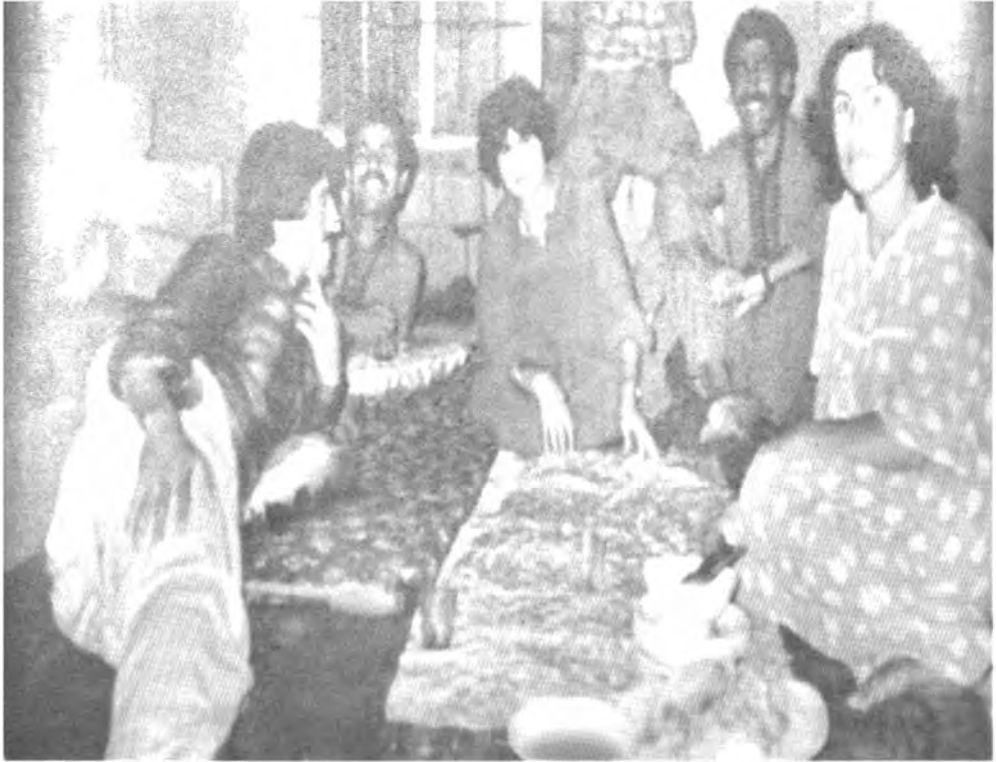
له بنكهي "نالاي شوږش" له زيوه. له راستهوه: نه جيبه حاجي كريم، نه بوبه كر خوشنار، مالتا، سامان مه لا كچكه، پيشه وا.