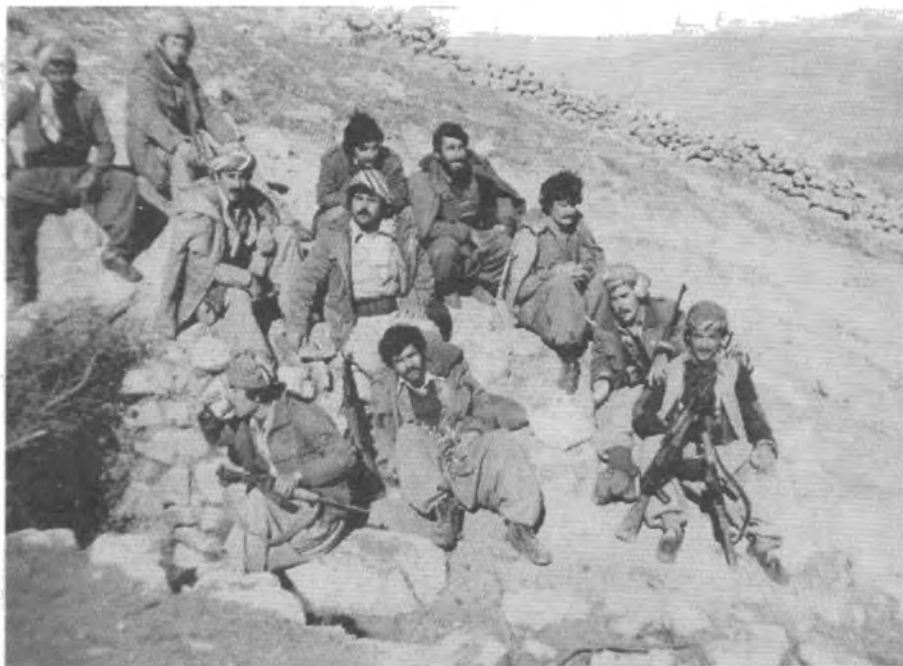
حاجی ناکرهم له گهل کۆمه لیک پینمه رگه