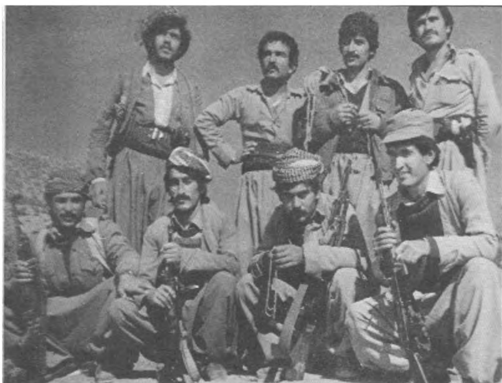
وریا کچکه له گهل کز مه لیک پیشمه رگه.