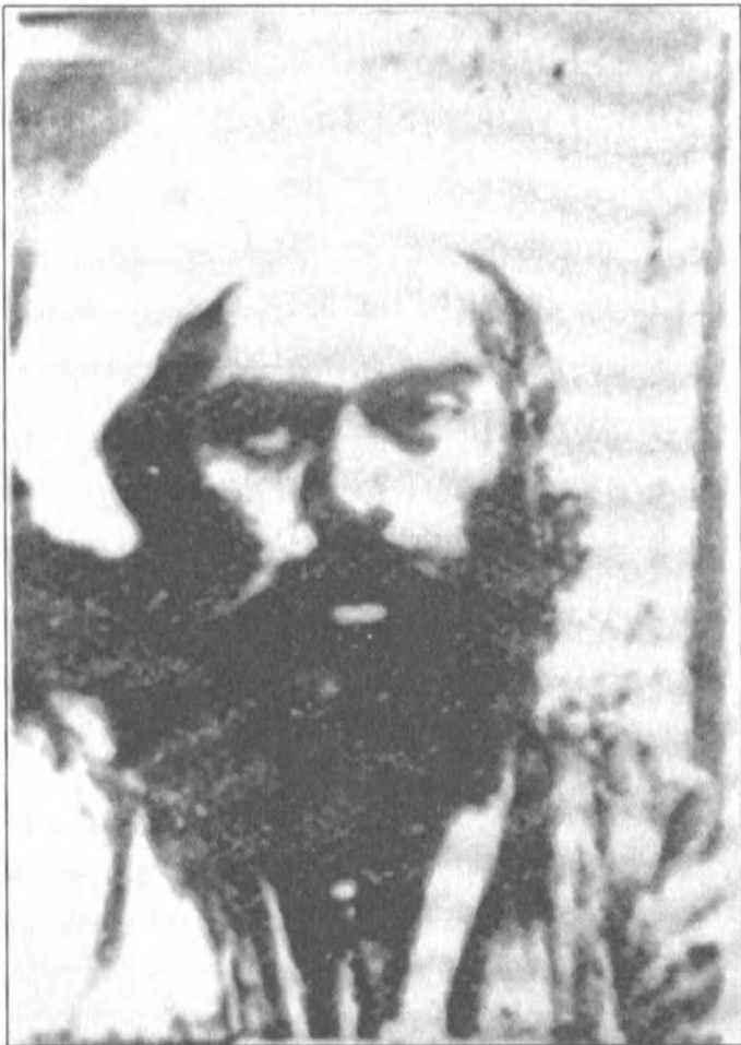
شیخ عبدالکرمی شہدہ