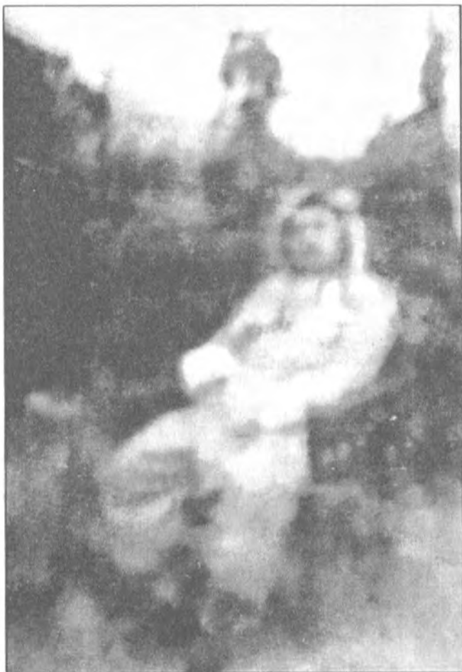
مامه رهزا ۱۹۵۳ کاتی نه خوشی